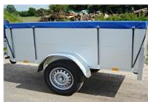
Vlakzeil bij opzetborden(optie)