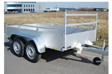
Stalen reling en voorrek (optie)