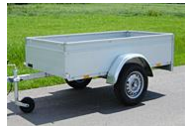
Aluminium reling (optie)